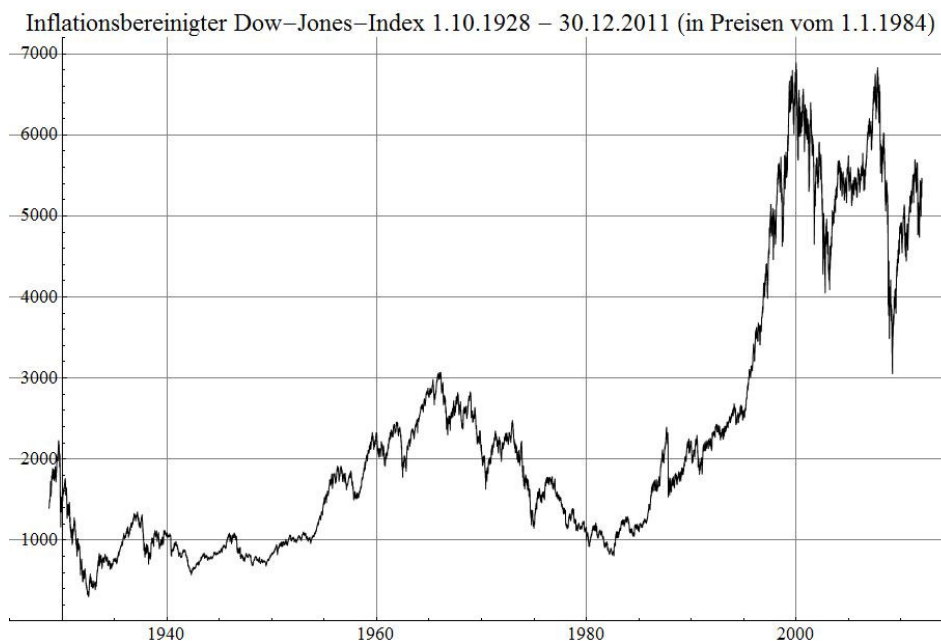
Abbildung 2: Inflationsbereinigter Dow Jones Index.

Es beginnt mit dem Crash, der die Weltwirtschaftskrise der 1930er Jahre einläutete, und endet mit Spekulationsblasen 3 und wiederum anschließenden Crashes im letzten Jahrzehnt.