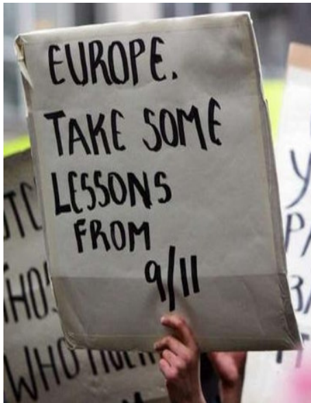
Europa, lerne aus dem 9.11.!