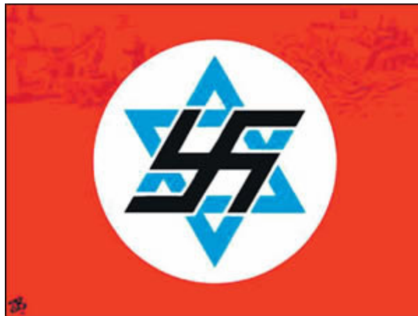
4. Star of David superimposed on the Third Reich flag. Al-Yawm (Saudi Arabia), November 30, 2005