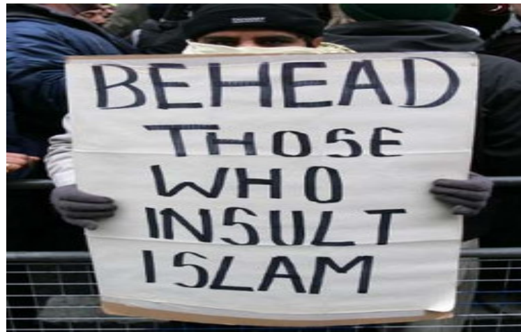
Schlagt diejenigen, die den Islam beleidigen!