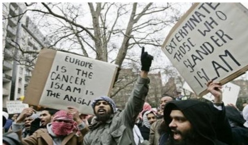
Europa ist der Krebs. Der Islam ist die Antwort!