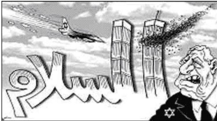
Al-Watan (Qatar) 6-23-02

The cartoon above, clearly depicting the railroad to the death camp at Auschwitz-Birkenau – but with Israeli flags replacing the Nazi ones – is from the Jordanian newspaper Ad-Dustur (October 19, 2003). The sign in Arabic reads: “Gaza Strip or the Israeli Annihilation Camp.” This accentuates the widespread libel that Israel’s policies towards the Palestinians have been comparable to Nazi actions towards Jews. Jordan is supposedly a moderate country at peace with Israel.