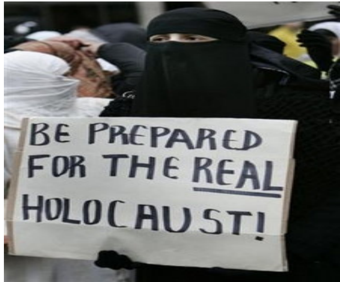
Bereitet euch auf den richtigen Holocaust vor!